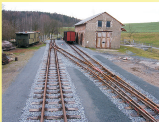
Lohsdorf / Ausfahrt nach Kohlmühle

Jeder Euro bringt uns unserem Ziel einen Schritt näher!