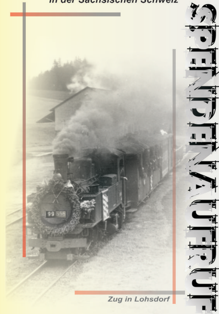
Zug in Lohsdorf

bittet um Ihre Unterstützung beim Wiederaufbau des Teilstückes Lohsdorf - Goßdorf-Kohlmühle der einzigen 750-mm-Schmalspurbahn in der Sächsischen Schweiz